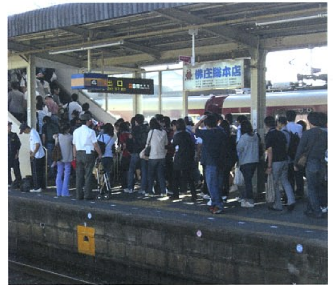
10月3日(土)予選当日、近鉄白子駅に到着したファン