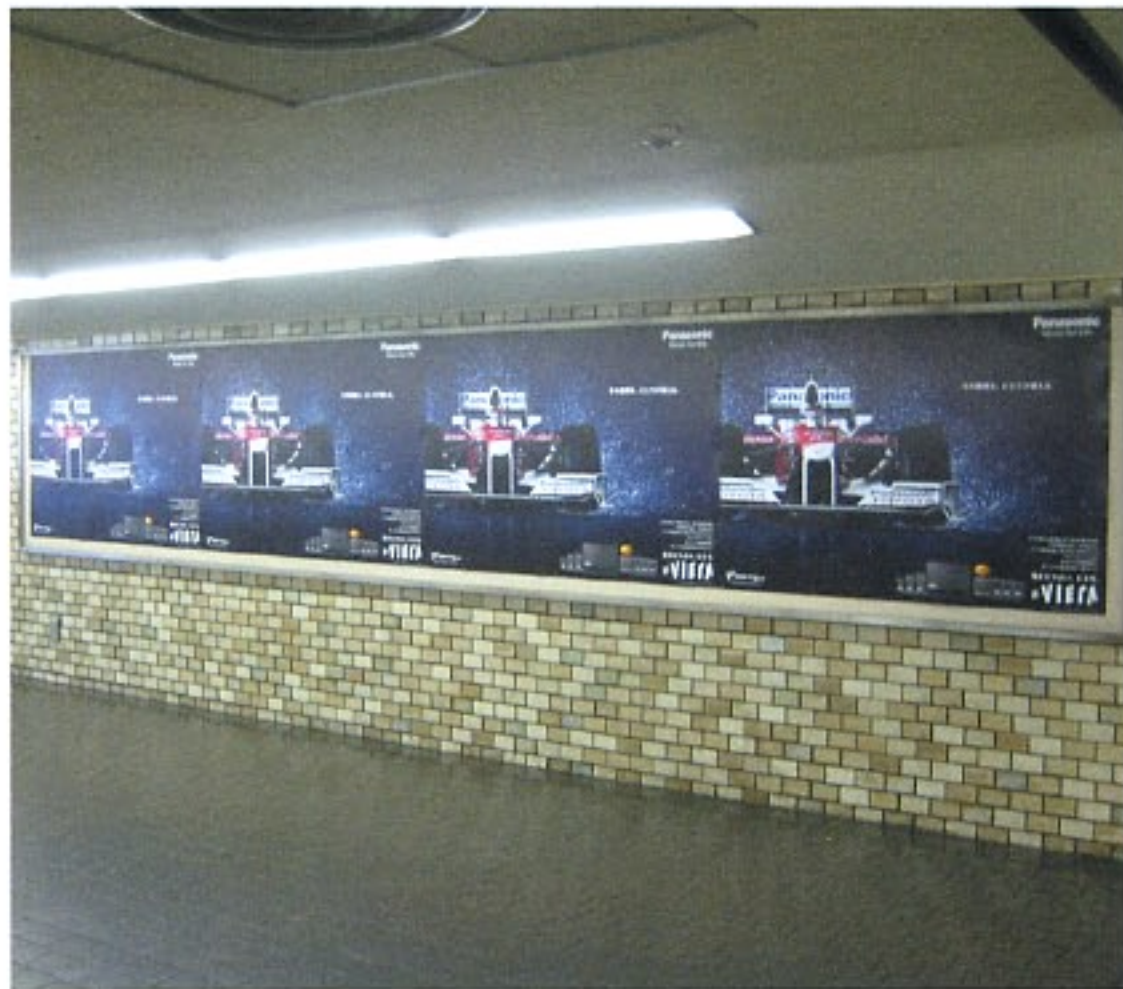
近鉄名古屋駅連絡通路4連ボード

鈴鹿サーキットでは2006年まで連続20回のF1GP開催を誇っていたが2007年・2008年は富士スピードウェイで開催され、今回から「鈴鹿」と「富士」の隔