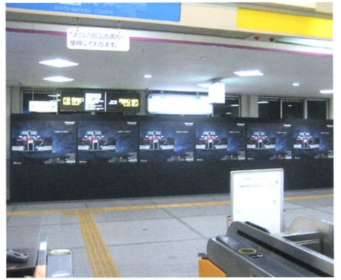
改札前特設ボード(B0×6連)