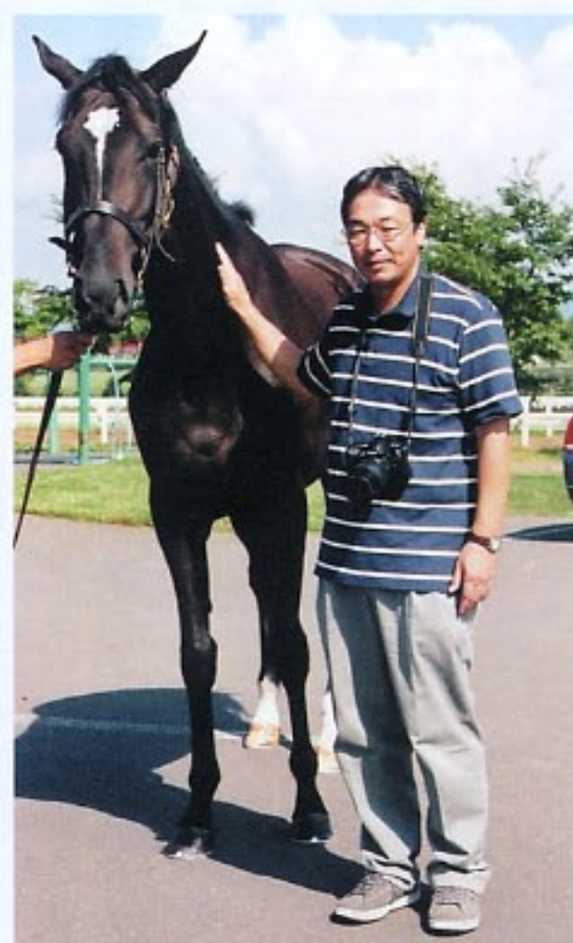
ダンスインザムードと私(04年夏・北海道の牧場にて)

多少でもかじった人ならば、知らない人はいい一時期のヒロインである。彼女はアメリカや香港の国際レースにも遠征し、アメリカでは優勝することもできた。さすがにアメリカまでは応援に行けなかったが、早朝の衛星生中継を家族全員で観て声援を送り歓喜した。家族といえど、子供たちは私の影響もあって以前から競走馬に興味を持っていたが、妻はそれに冷たい視線を送っていた。しかし、現金なものでムードの活躍により態度が一変。そのころから「オレのペット」は「我家のペット」になってしまった。彼女はすでに現役を引退し母親になっている。今は、来年デビューするムードの長女の活躍が待ち遠しい。