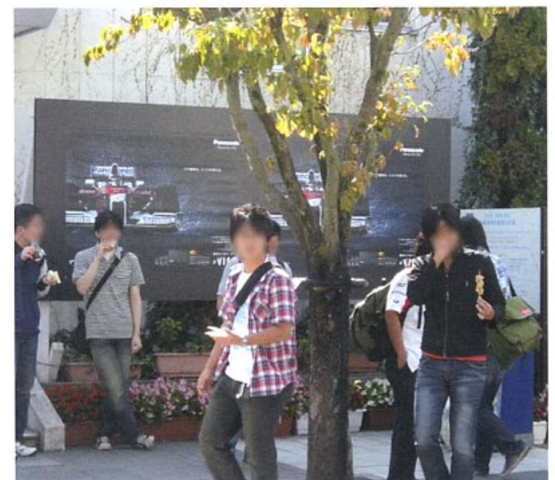
駅前ロータリー特設ボード(B0×2連)

この3年ぶりの開催に伴い、パナソニック株式会社様による近鉄名古屋線名古屋駅および白子駅ポスター集中掲出(駅ジャケット)を実施した。