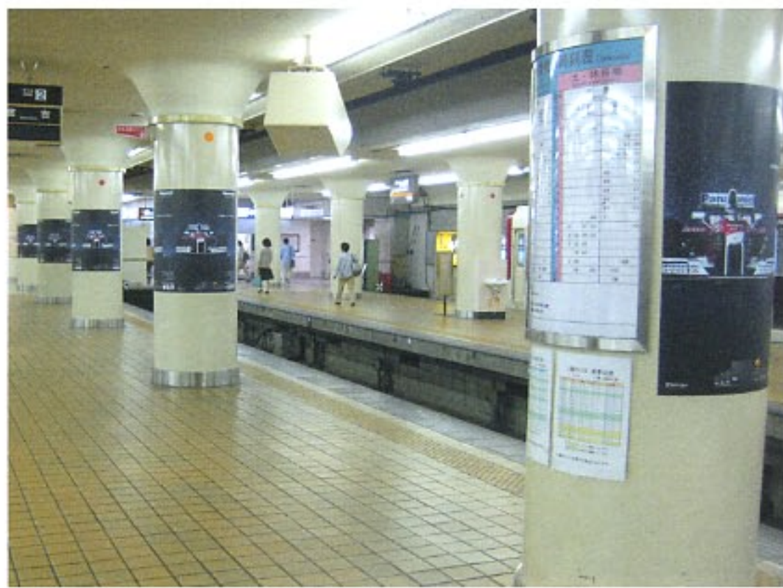
近鉄名古屋駅ホームB1集中貼り

年開催が決定していたところであるが、7月に富士スピードウェイはF1GP開催中止を発表した。