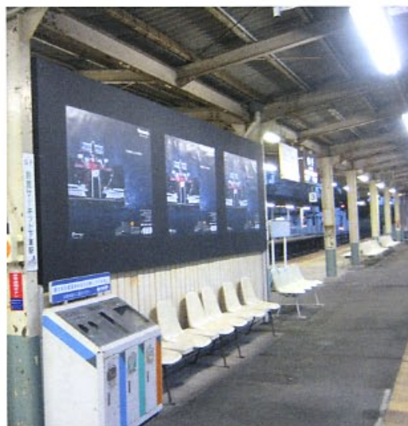
ホーム特設ボード(B0×3連)