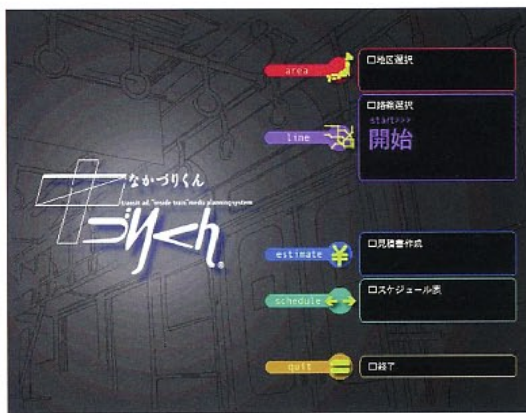
新 駅ちようさん 中づくりくん