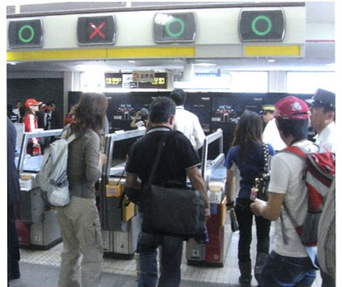
改札前特設ボード(B0×6連)